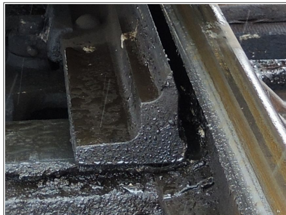
Obr. č. 5: Rozevření pravého jazyka výhybky