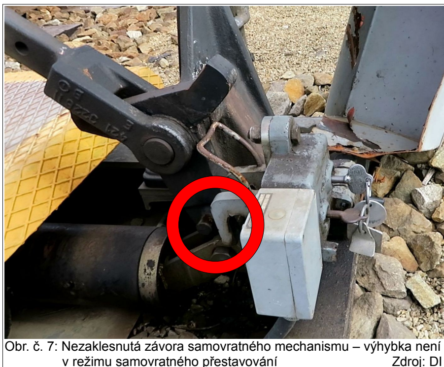
Obr. č. 7: Nezaklesnutá závěra samovratného mechanismu – výhybka není v režimu samovratného přestavování

Protože závěra nezaklesla do čepů hydraulického tlumiče, výhybka č. 2sv nebyla v režimu samovratného přestavování a držena v přednostní poloze na SK č. 1. Světelné návěstidlo výhybky se samovratným přestavníkem Sv2 však bylo zhaslé, tj. nebylo indikováno správné přestavení výhybky do přednostní polohy pro směr jízdy proti hrotu výhybky návěstí „Jízda zajištěna“, čímž byla při dodržení stanovených technologických postupů strojvedoucím vlaku Os 18000 jednoznačně zajištěna bezpečnost provozování dráhy a drážní dopravy.