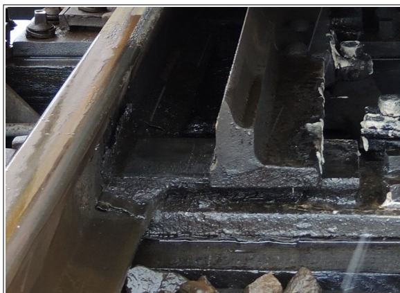
Obr. č. 4: Rozevření levého jazyka výhybky