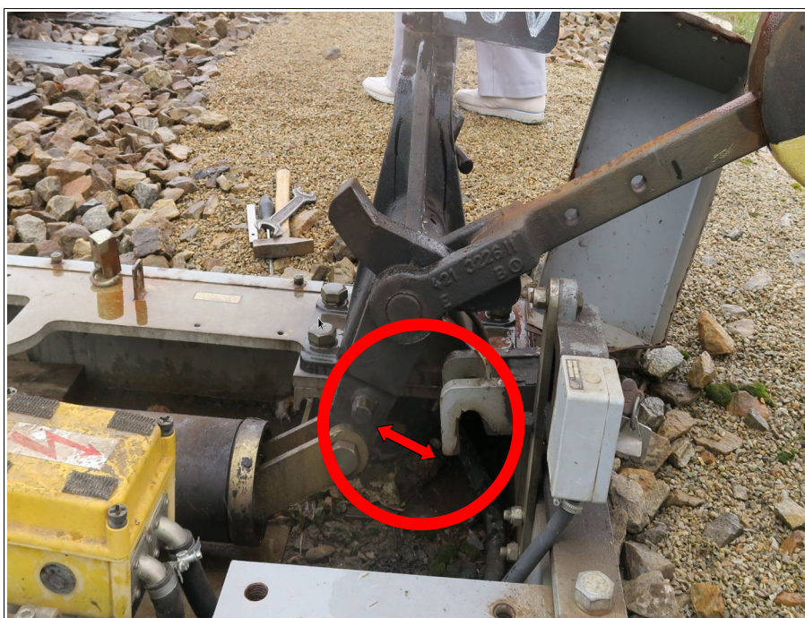
Obr. č. 6: Nezaklesnutá závora samovratného mechanismu