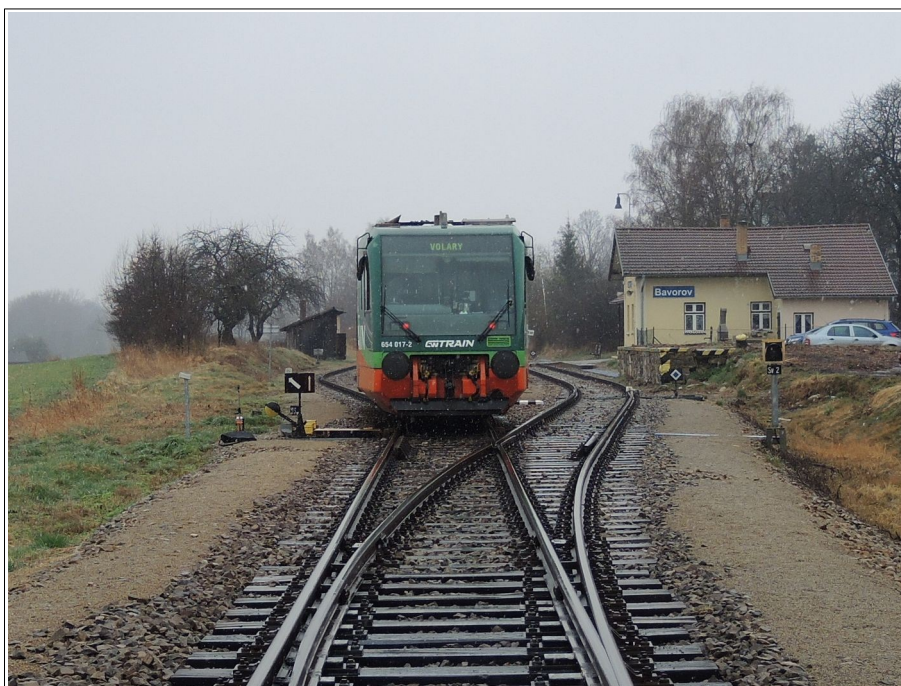
Obr. č. 3: Pohled na výhybku č. 2sv