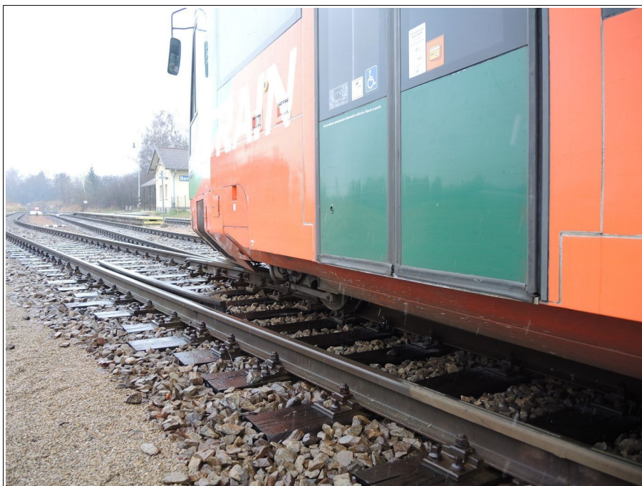
Obr. č. 2: Vykolejený první podvozek vlaku Os 18000