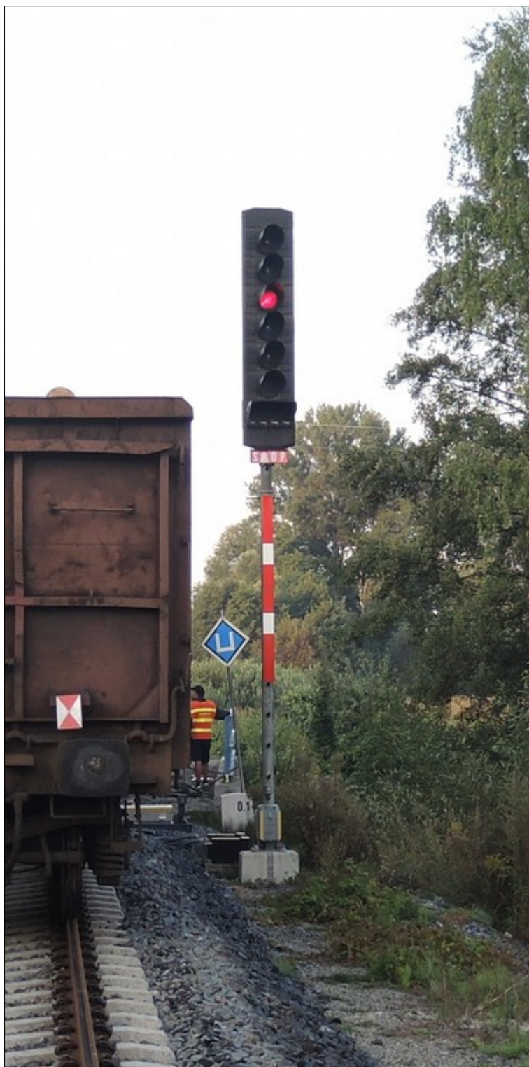
Obr. č. 4: Návěstidlo S90P vpravo u SK č. 90 a část návěstního TDV vlaku Mn 81300.