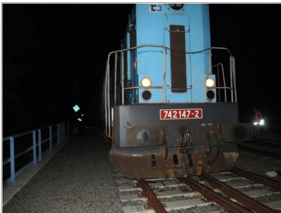
Obr. č. 1: Pohled na přední čelo vlaku Mn 81300 po vzniku MU.