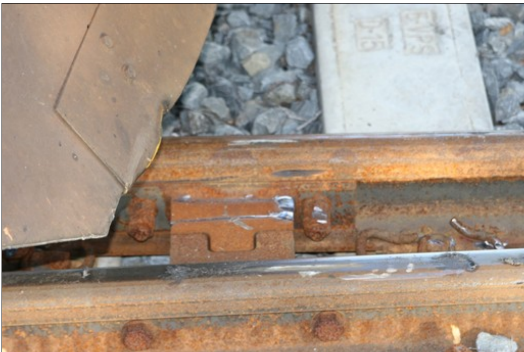
Obr. č. 6: Stopy po vykolejení HDV na zámku proti putování jazyka výhybky č. 2.