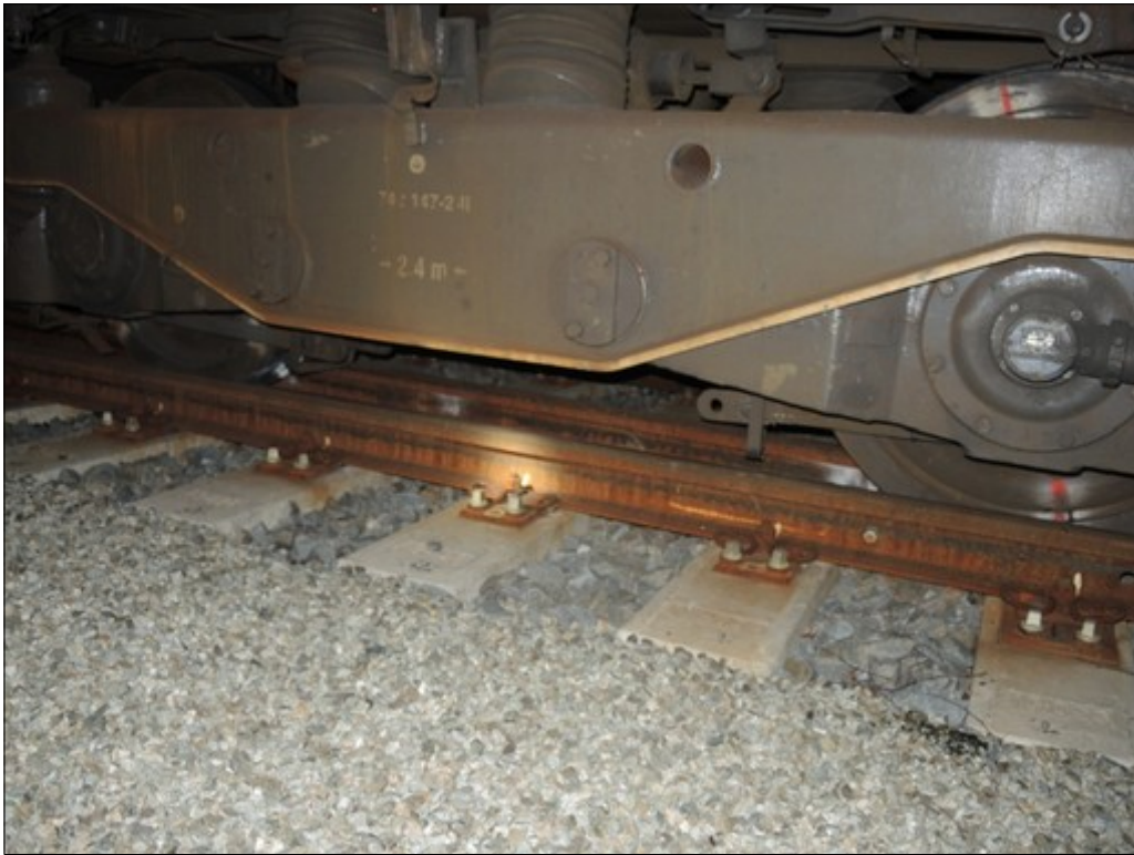
Obr. č. 5: Vykolejený podvozek HDV vlaku Mn 81300 v konečném postavení po MU.