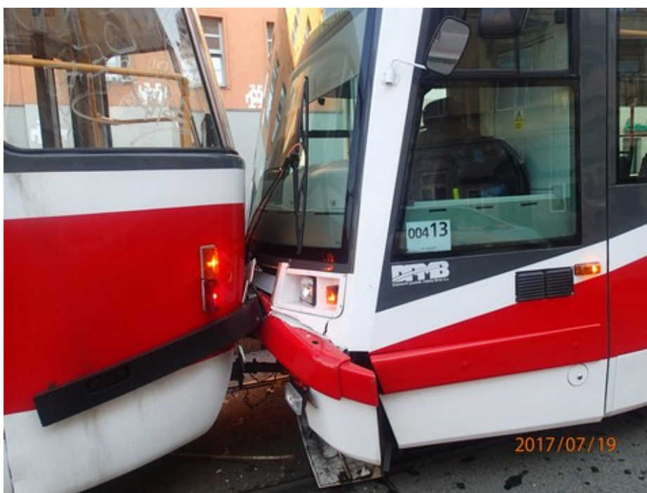
Obr. č. 1: Pohled na místo vzniku MU