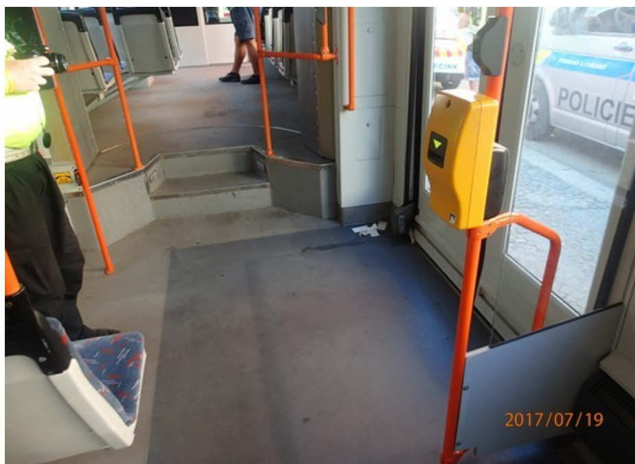
Obr. č. 8: Pohled do vnitřního prostoru na místo pádu cestující