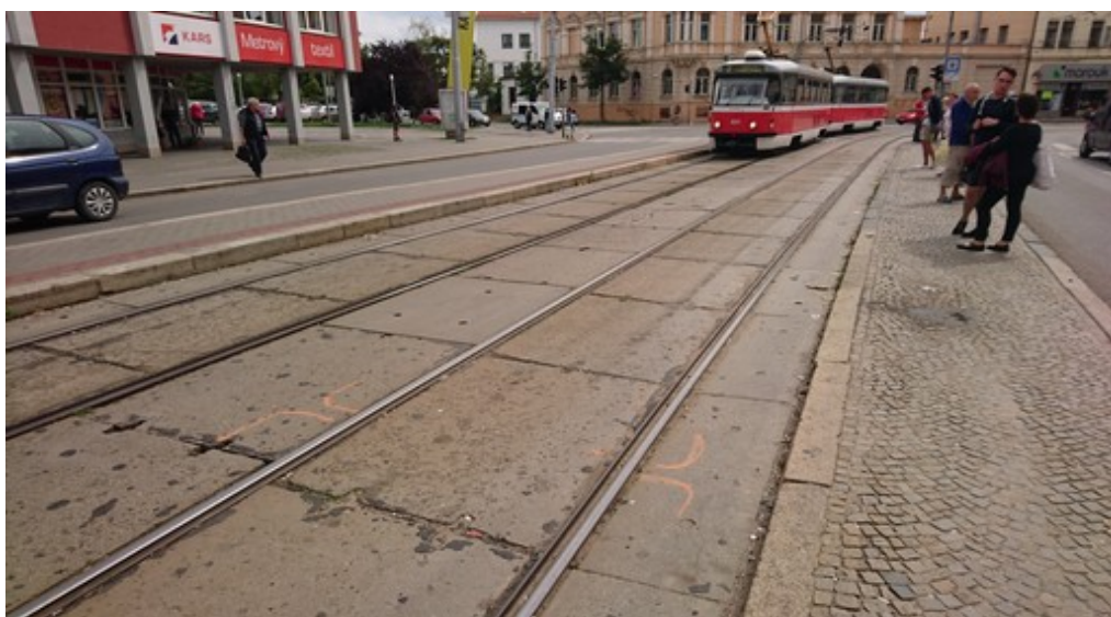
Obr. č. 5: Pohled na zastávku Tkalcovská

Provedená komisionální prohlídka a následná technicko-bezpečnostní zkouška tramvaje č. 4 na zkušebním úseku tramvajové trati Brno-Komín prokázaly, že tramvaj ŠKODA typ ANITRA, ev. č. 1821, řazená na lince č. 4, byla v technickém stavu, který vyloučil její příčinnou souvislost se vznikem MU.