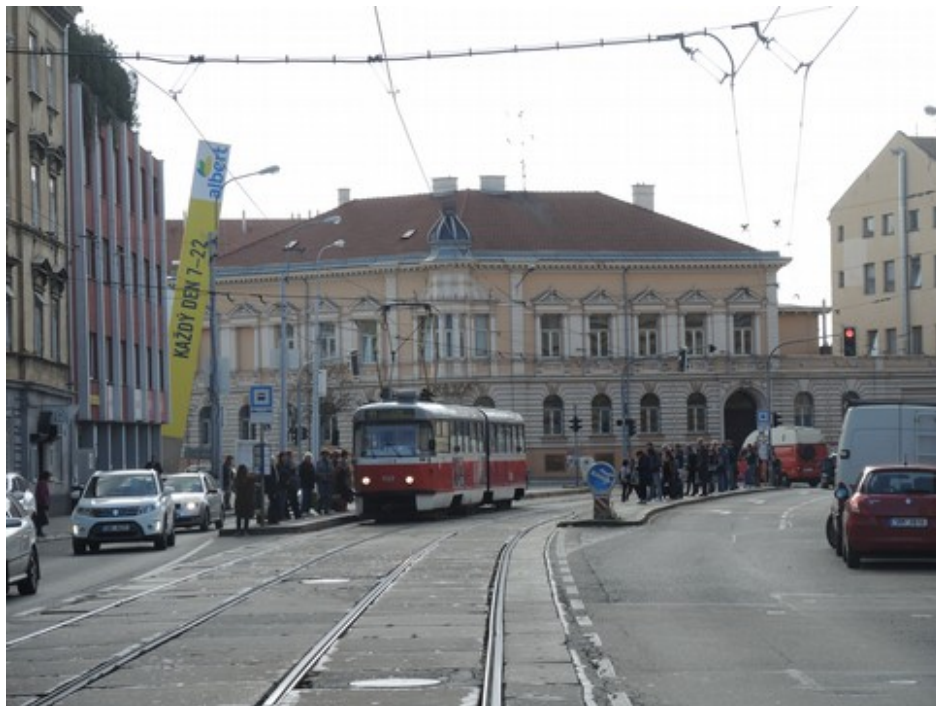
Obr. č. 9: Pohled na zastávku Tkalcovská