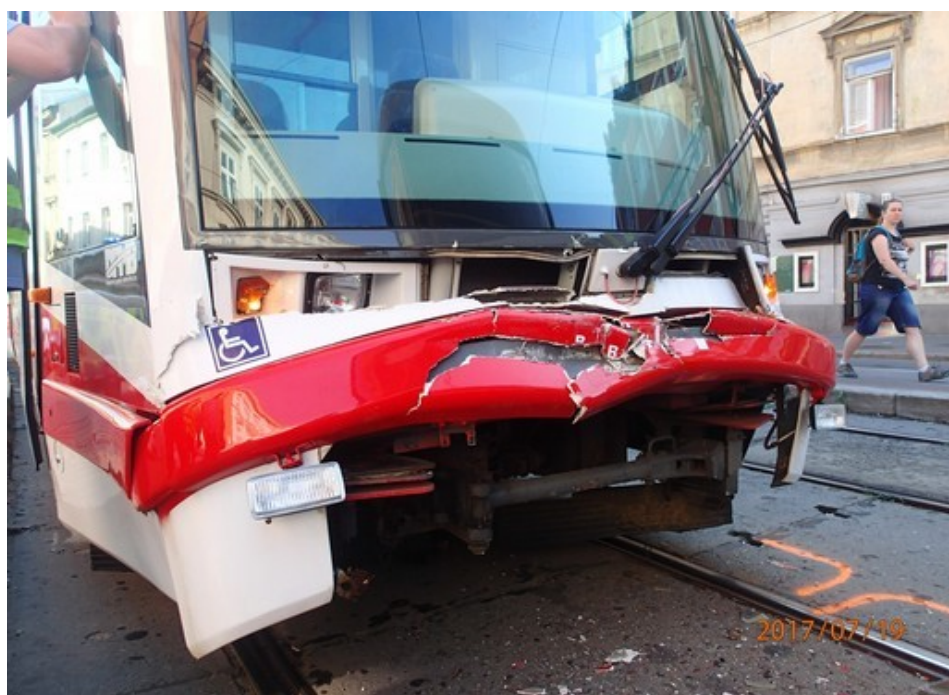
Obr. č. 7: Pohled na přední část tramvaje č. 4 po MU