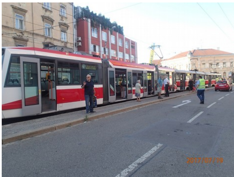
Obr. č. 6: Pohled na místo MU