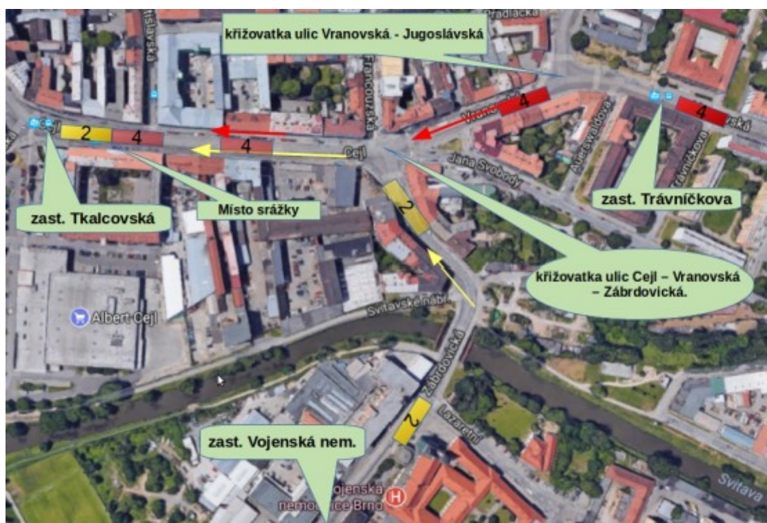
Obr. č. 4: Schéma situace před MU