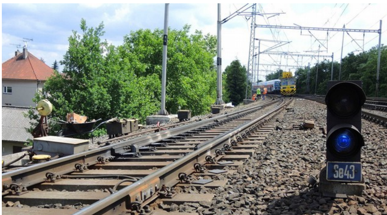
Obr. č. 6: Návěstidlo Se43 s návěstí „Posun zakázán“ u výhybky č. 45 se pro jízdu MVTV neobsluhovalo.