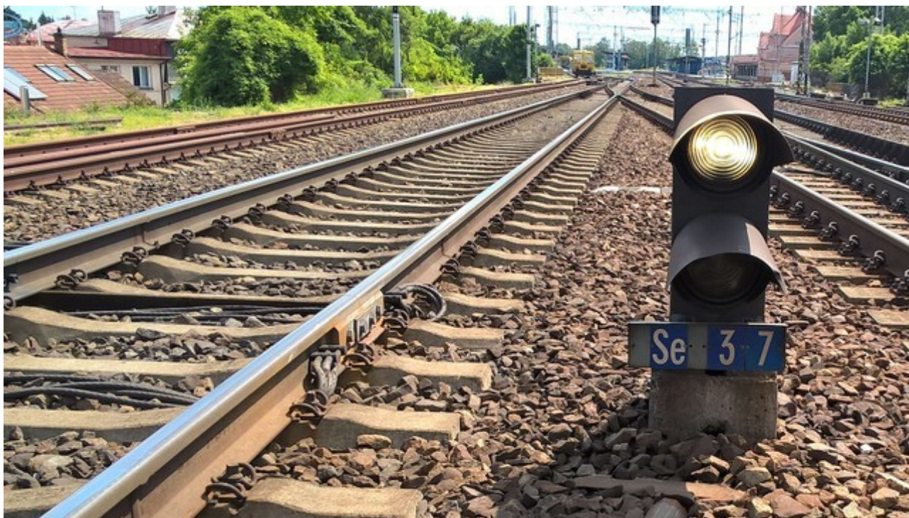
Obr. č. 7: Souhlas k posunu z vyloučené 2. SK na 4. SK udělil traťový dispečer CDP Praha rozsvícením návěsti „Posun dovolen“ na návěstidle Se37. K jízdě MVTV za toto návěstidlo z důvodu vzniku MU již nedošlo.