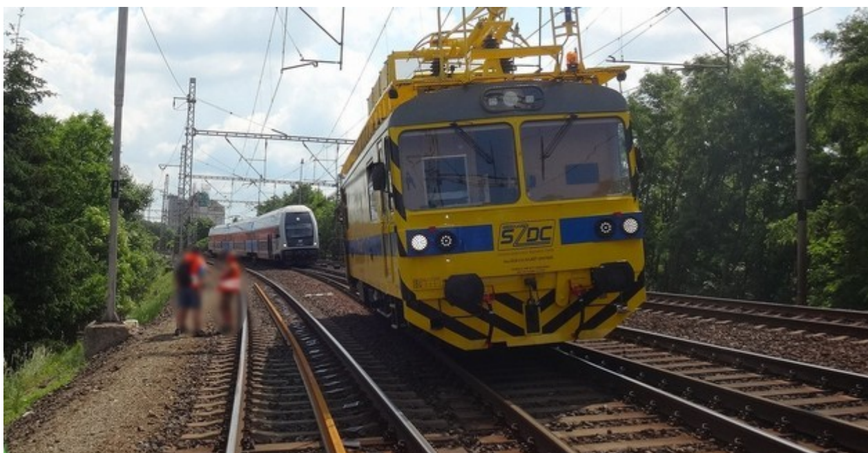
Obr. č. 1: Poloha DV po zastavení.