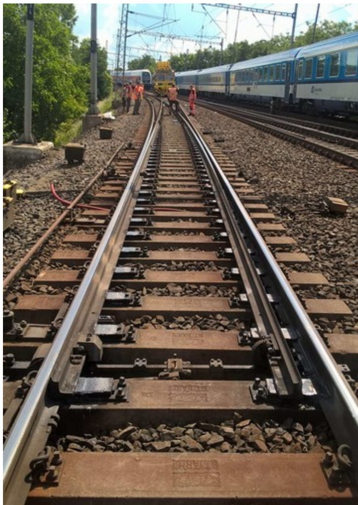
Obr. č. 3: V době vzniku MU a při ohledání místa byla výhybka č. 45 přestavena do odbočného směru vpravo směrem do 0. staniční koleje, vpravo vlak jedoucí po 1. staniční koleji.

chybových hlášení zabezpečovacího zařízení byl po dobu odpojování těchto zařízení připojen URDO do kabelového rozvodu v reléové místnosti žst. Český Brod. Zabezpečovací zařízení obsluhované dálkově traťovým dispečerem Úvaly – Český Brod z CDP Praha poté vyhodnocovalo postavení výhybek č. 45 a 43 do přímého směru, bez bočního ohrožení vlakových cest vedených po 0. traťové koleji. Funkce ručního stavění výhybky č. 45 výměníkovým závažím zůstala zachována. V tuto dobu nebyla výhybka žádným technickým opatřením zajištěna proti přestavení do odbočného směru vpravo (např. ambulantním výměnovým zámkem), což umožnilo vjezd do provozované 0. staniční koleje. K ručnímu přestavení výhybky č. 45 tímto směrem došlo ze strany pracovníků stavby. Žádná z osob přítomných v době vzniku MU u výhybky se ke změně její polohy nepřihlásila. V takové poloze byl pravý jazyk odlehnutý od opornice, což bezpodmínečně vyžadovala pouze kompletní demontáž snímače polohy jazyka (SPA). Demontáž válečkových stoliček dotlačovacích (VSD) a válečkových stoliček typu EKOSLIDE bezpodmínečně nevyžaduje jazyk odlehlý od opornice. V době vzniku mimořádné události nebylo odpojování výhybky č. 45 zcela dokončeno – zbývalo demontovat tři čelistové závěry na pravém jazyku a odpojit výhybku od výměníkového závaží pro ruční stavění.