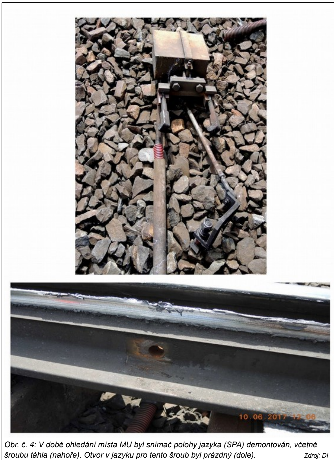
Obr. č. 4: V době ohledání místa MU byl snímač polohy jazyka (SPA) demontován, včetně šroubu táhla (nahore). Otvor v jazyku pro tento šroub byl prázdný (dole).