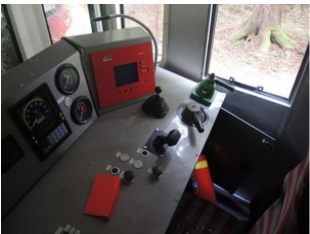
Obr. č. 6: Detail stanoviště strojvedoucího HDV č. 90 54 3 805 901-6