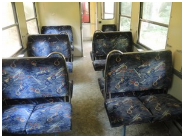
Obr. č. 9: Interiér TDV řady Balm/ú č. 632 po srážce