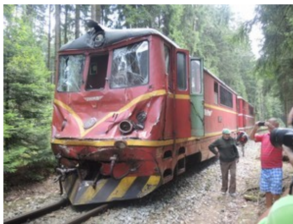
Obr. č. 5: Poškození přední části HDV č. 90 54 3 705 911-6