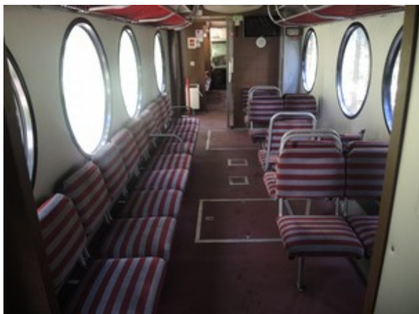
Obr. č. 8: Interiér HDV č. 90 94 3 805 901-6 po srážce. V druhé řadě sedadel vpravo se nachází sedadlo, u něhož došlo při srážce k utržení opěradla