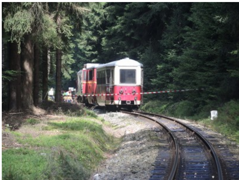
Obr. č. 12: Vzájemná viditelnost vlaků před srážkou (pohled strojvedoucího vlaku MOs 204)

Trat' se v místě srážky vlaků nachází v oblouku, z obou stran oblouku je v bezprostřední blízkosti trati vzrostlý les. Z výše uvedených důvodů mohli strojvedoucí MU dotčených vlaků spatřit protijedoucí vlak na vzdálenost cca 150 m. Oba strojvedoucí po spatření protijedoucího vlaku ihned na tuto skutečnost v souladu s vnitřními předpisy provozovatele dráhy a dopravce reagovali zavedením rychločinného brzdění a učinili vše, aby srážce vlaků zabránili.