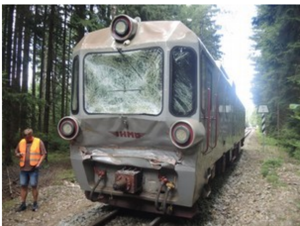
Obr. č. 4: Poškození přední části HDV č. 90 54 3 805 901-6

Při srážce došlo k deformaci čelních stěn obou HDV. Konstrukce obou HDV zúčastněných na MU zajistila i po deformaci čelních stěn dostatečný prostor na stanovištích strojvedoucích tak, aby byly zajištěny podmínky pro přežití osob řídicích tato DV.