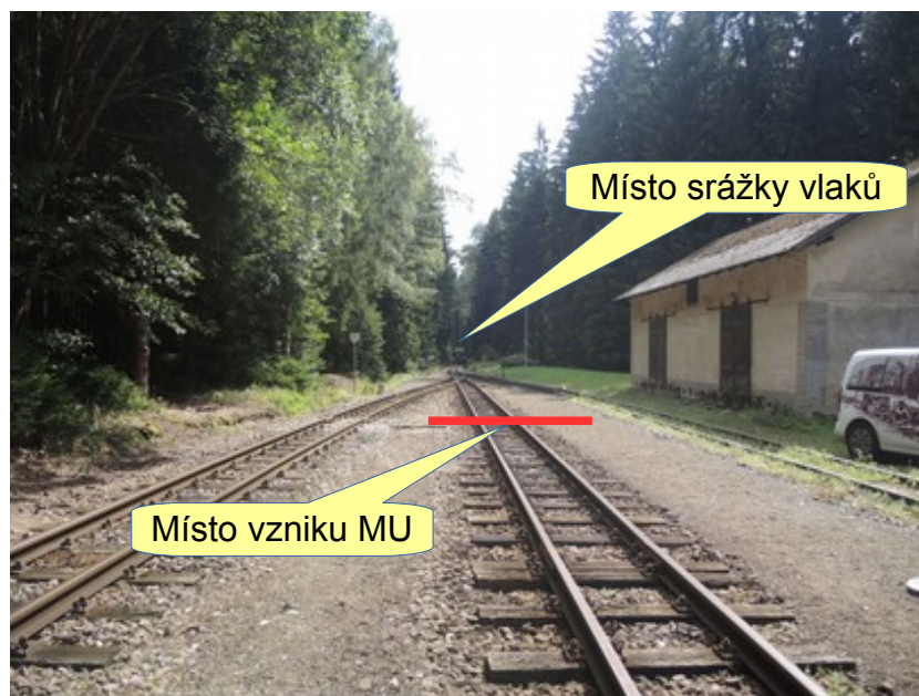
Obr. č. 10: Místo vzniku MU a místo srážky vlaků

Dne 30. 8. 2016 odjel v 6.58 h z dopravní Obrataň vlak MOs 203. V 6.09 h odjel z žst. Jindřichův Hradec vlak MOs 204. Vlaky odjely podle jízdního řádu včas. Podle GVD je pravidelné křížování těchto vlaků v dopravně Chválkov. Oba vlaky měly v této dopravně ve svých TJŘ vyznačeno křížování. Vlak MOs 203 však v dopravně Chválkov nezastavil a pokračoval v jízdě směrem k dopravně Včelnička. Na širé trati mezi dopravnou Včelnička a dopravnou Chválkov došlo v km 30,244 ke srážce s protijedoucím vlakem MOs 203.