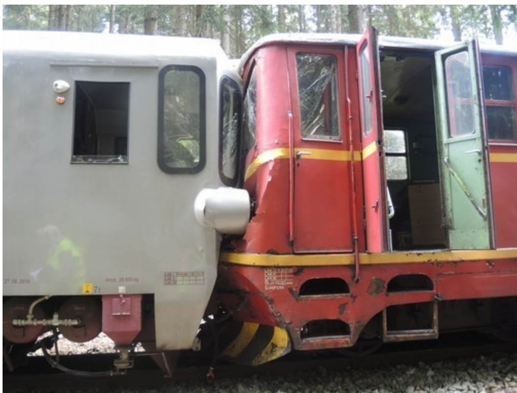
Obr. č. 1: Pohled na místo srážky vlaků

GPS: 49°20'21.525"N, 14°59'8.526"E (místo srážky vlaků).