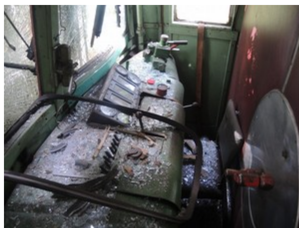
Obr. č. 7: Detail stanoviště strojvedoucího HDV č. 90 54 3 705 911-6

Ohledáním prostorů pro cestující obou DV bylo zjištěno, že nic nenasvědčuje tomu, že by ke zranění cestujících došlo nevhodným uspořádáním interiéru, případně uvolněním nějakých součástí vybavení těchto DV.