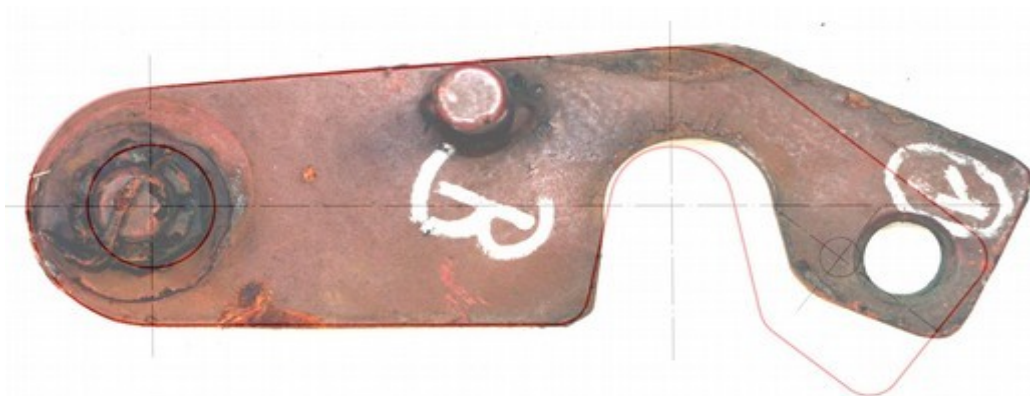
Obr. č. 5: Značná neshoda – odlišný tvar a rozměr pojistky ve srovnání s předepsaným obrysem tvaru a rozměrem dle výrobního výkresu Zdroj: Znalecký posudek