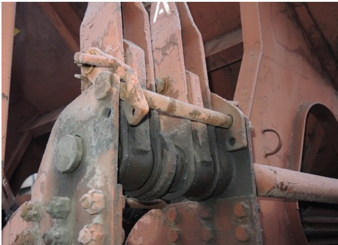
Obr. č. 7: Správné zaklesnutí (vpravo) a chybné zaklesnutí s vůlí (vlevo)