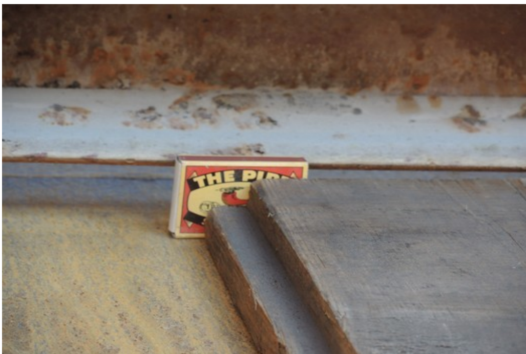
Obr. č. 6: Stav otevření výsypné klapky při ověřovacím pokusu dne 7. 12. 2017 v žst. Tišnov při porovnání s krabičkou zápalek o výšce 37 mm u TDV 81 54 6996 454-9