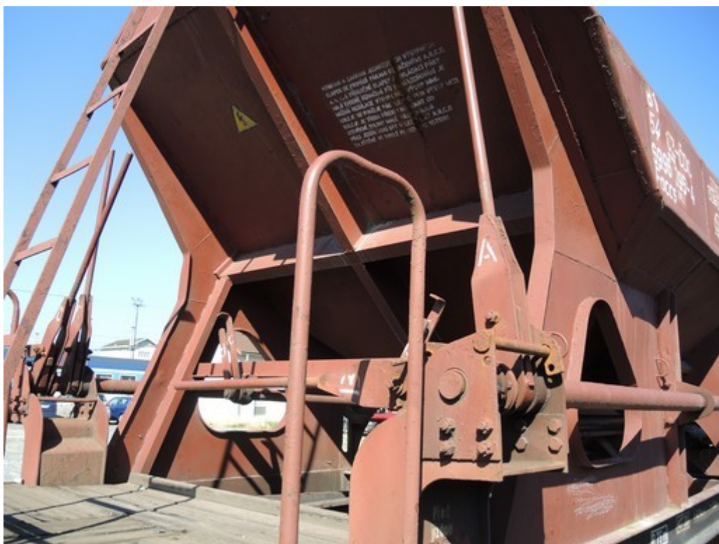
Obr. č. 9: Stav pák výsypných klapek a pojistek na 2. TDV za HDV po MU (klapky B a D otevřeny)