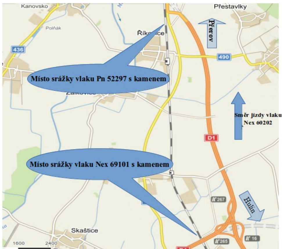
Obr. č. 2: Schéma místa vzniku MU

kamenem odlétnutým z TDV vlaku Nex 60202 dopravce ČD Cargo, a. s., v traťovém úseku Hulín – Říkovice v km 170,440. O cca 5 minut později, v traťovém úseku Říkovice – Přerov, došlo k další srážce vlaku Pn 52297 (dopravce IDS Cargo a. s.), opět s kamenem odlétnutým z vlaku Nex 60202, s následným rozbitím levého vyhřívaného čelního pozičního světla na HDV 193 220-1 (nájemce LokoTrain, s. r. o.).