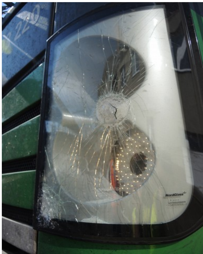
Obr. č. 13: Detail poškození krytu levého pozičního světla u HDV 193 220-1 D-ELOC