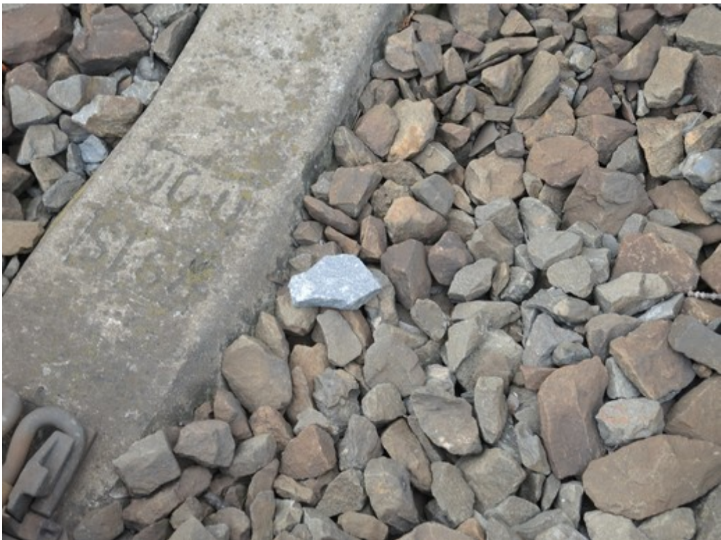
Obr. č. 12: Kámen nesoucí stopy nárazů v prostoru 1. TK u zastávky Záhlinice