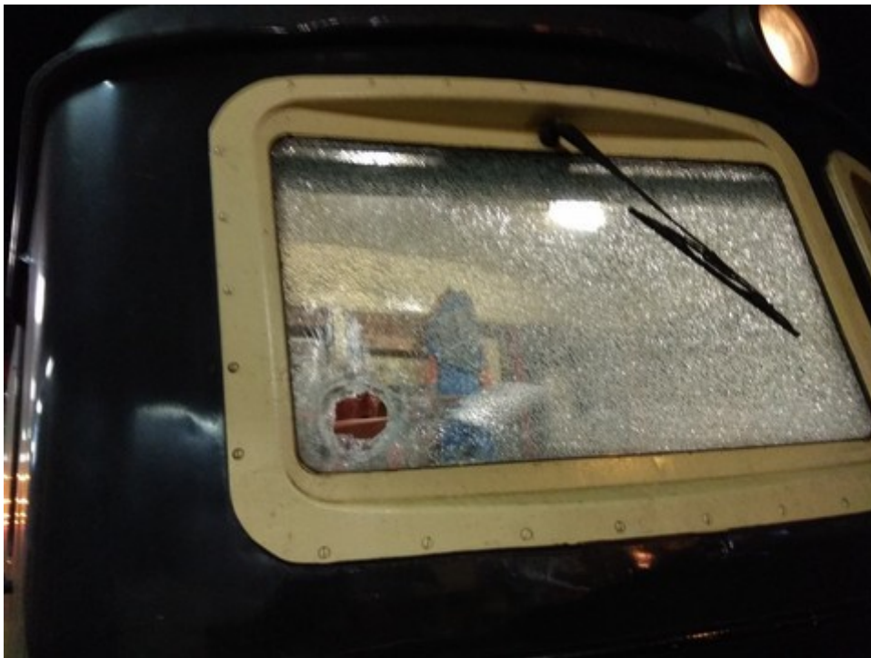
Obr. č. 1: Rozbité čelní sklo na HDV 121 041-8 vlaku Nex 69101

GPS: 49°19'56.1145"N, 17°27'55.5455"E; 49°23'22.9886"N, 17°27'12.2514"E.