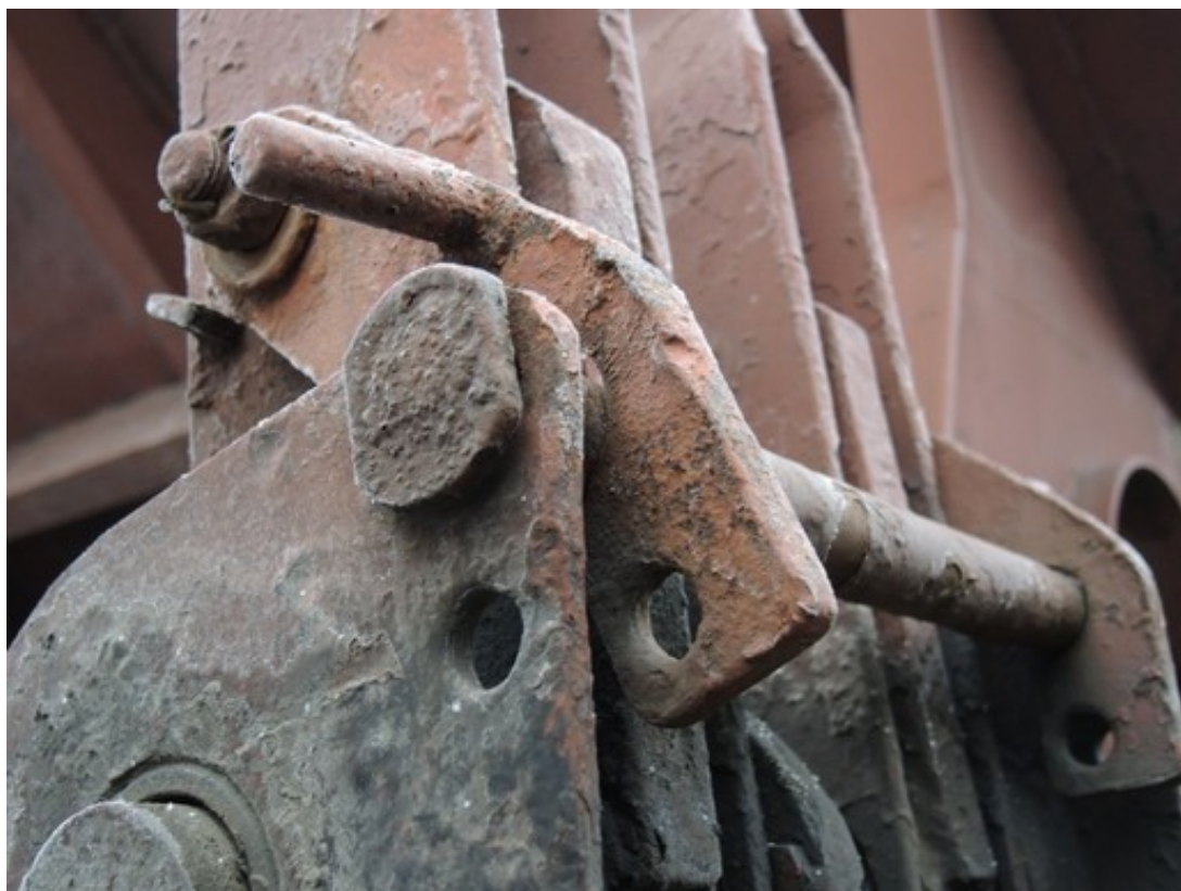
Obr. č. 8: Otvory na pojistce a stojanu ovládacích pák určené pro plomby

Vzhledem k všem výše uvedeným zjištěným skutečnostem DI doporučuje provést mimořádnou kontrolu pojistek ovládacích pák segmentových výsypaných klapek u všech TDV řady Faccs 295.2 a Faccs 407.0 výrobců „Vagónka Studénka, národní podnik, a Vagónka Poprad, národní podnik“ a jejich uvedení do stavu schváleného výrobní dokumentací. Důvodem je zvýšení bezpečnosti provozu těchto již letitých TDV. Je potřeba také zavést účinné opatření proti samovolnému otevření segmentových výsypaných klapek za jízdy u prázdných TDV (např. zajistit pojistky plombami, elektrikářskými stahovacími pásky apod – viz obr. č. 8).