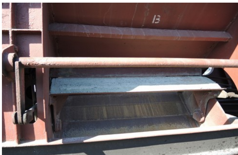
Obr. č. 10: Plně otevřená klapka B na 2. TDV za HDV (do prostoru druhé traťové koleje)