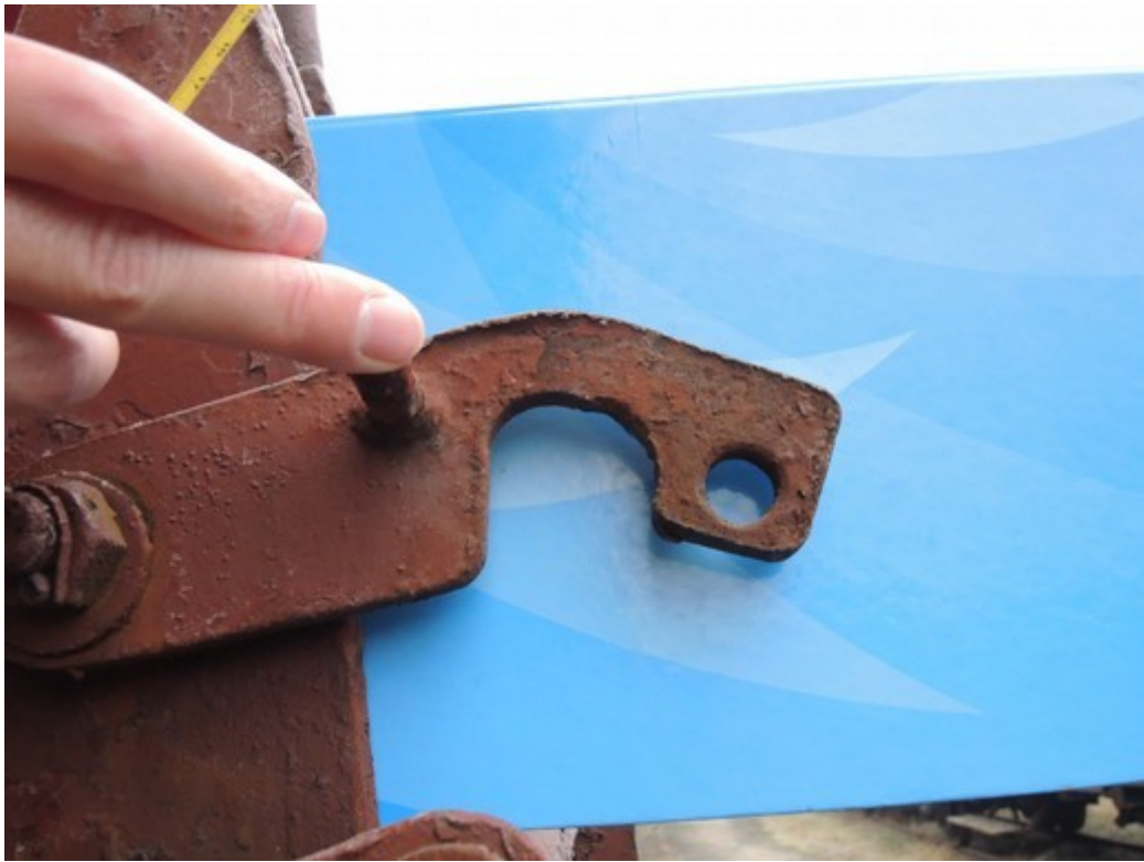
Obr. č. 11: „Upravená“ pojistka autogenem v místě zaklesnutí čepu a roztlučená kladivem v horní části