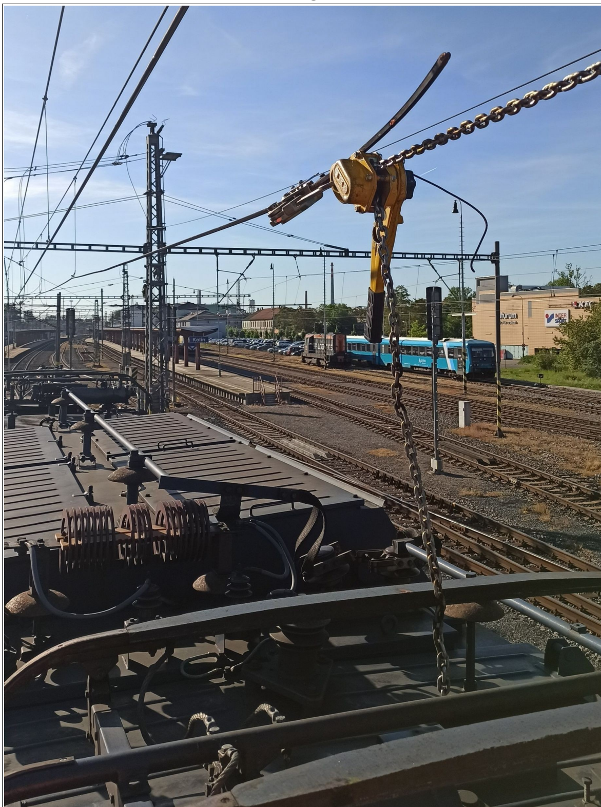
Obr. č. 4: Pohled na střechu HDV 163.244-7 a na TV upevněný řehťákový zvedák s volně visícím řetězem dotýkajícím se ližiny sběrače HDV po vzniku předmětné MU