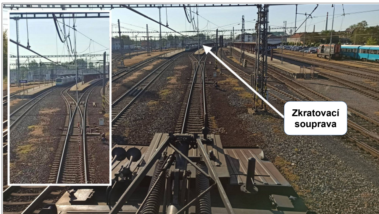
Obr. č. 5: Pohled na střechu HDV 163.244-7 a na TV před vznikem předmětné MU, kdy zkratovací souprava umístěná před pracovním místem ze strany od Záboří n. L. ve výměnném poli mechanického/elektrického dělení ÚO 441 byla připojena na levý trolejový drát ukotvený k TP č. 143 a 163 (ve výřezu je přiblížení jejího umístění)