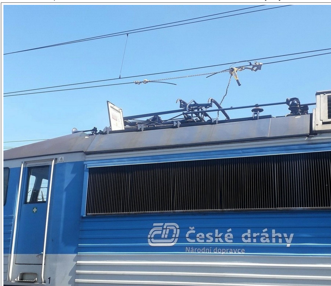
Obr. č. 2: Pohled na TV a na něm upevněný řehťákový zvedák v místě vzniku MU – újmý na zdraví zaměstnance provozovatele dráhy