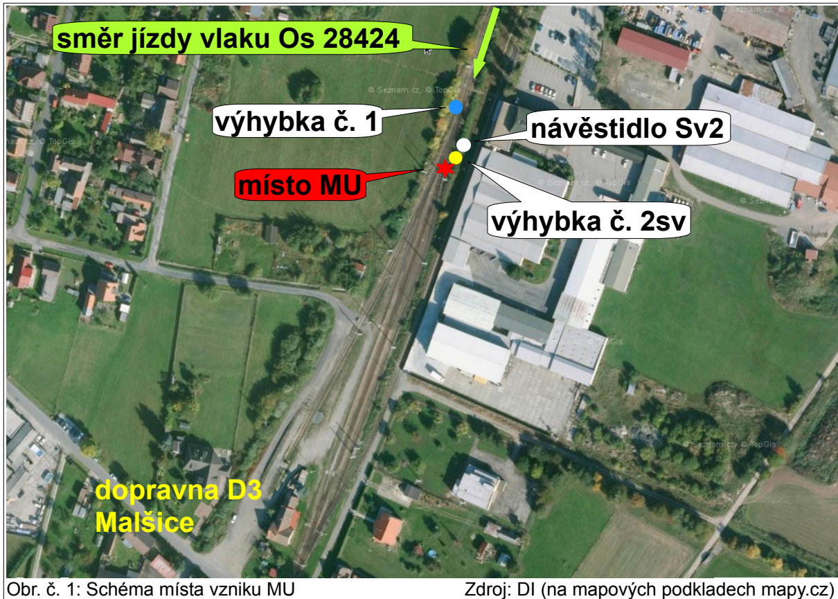
Obr. č. 1: Schéma místa vzniku MU

Dopravna D3 Malšice leží na železniční dráze regionální v km 10,406 jednokolejné trati Tábor – Bechyně, na které se drážní doprava organizuje tzv. zjednodušeným řízením drážní dopavy. Hranice dopravní D3 Malšice ve směru od dopravní D3 Slapy je určena nepřenositelným návěstidlem Lichoběžníková tabulka.