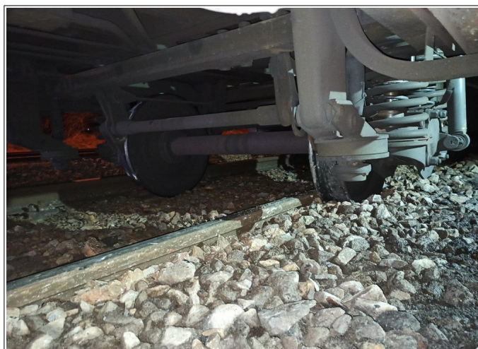
Obr. č. 3: Vykolejený podvozek TDV 93-29 020-7