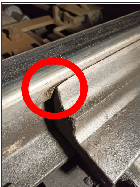
Obr. č. 4: Stopy po otěru kol HDV na levé opornici