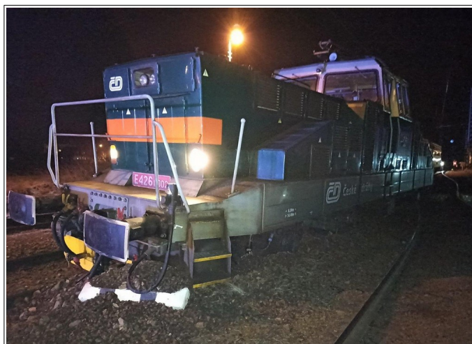
Obr. č. 2: Vykolejené HDV vlaku Os 28424