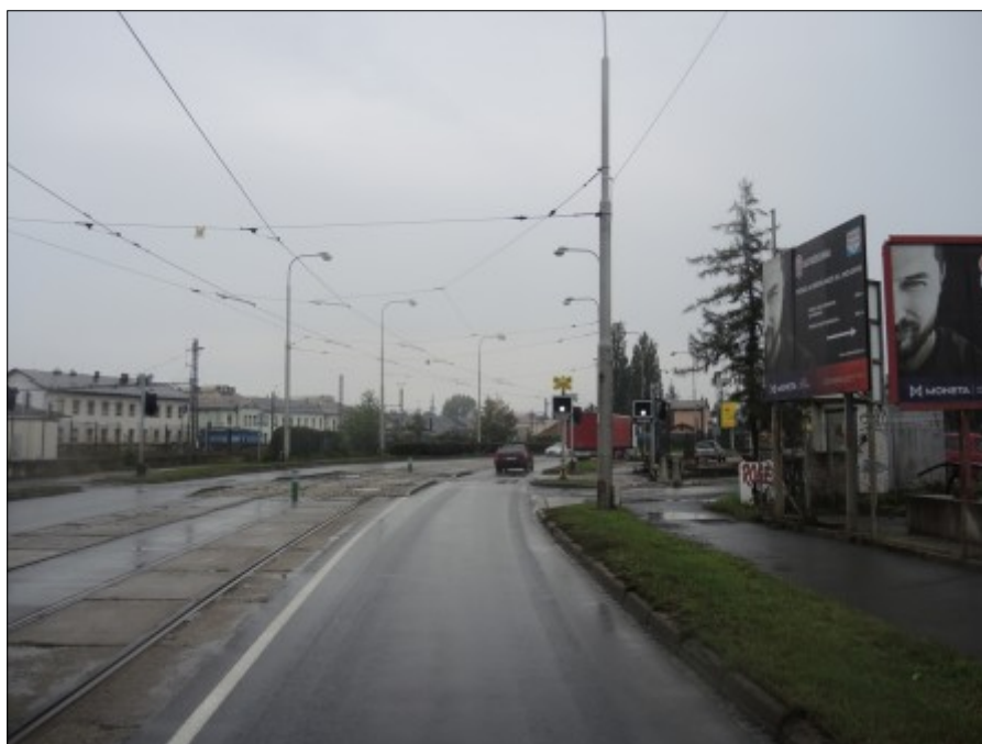
Obr. č. 5: Viditelnost výstražníku „A“ umístěného vpravo pravého jízdního pruhu pozemní komunikace a výstražníku „E2“ umístěného vpravo pozemní komunikace ze vzdálenosti 40 m na ul. Divišova ve směru jízdy NA.