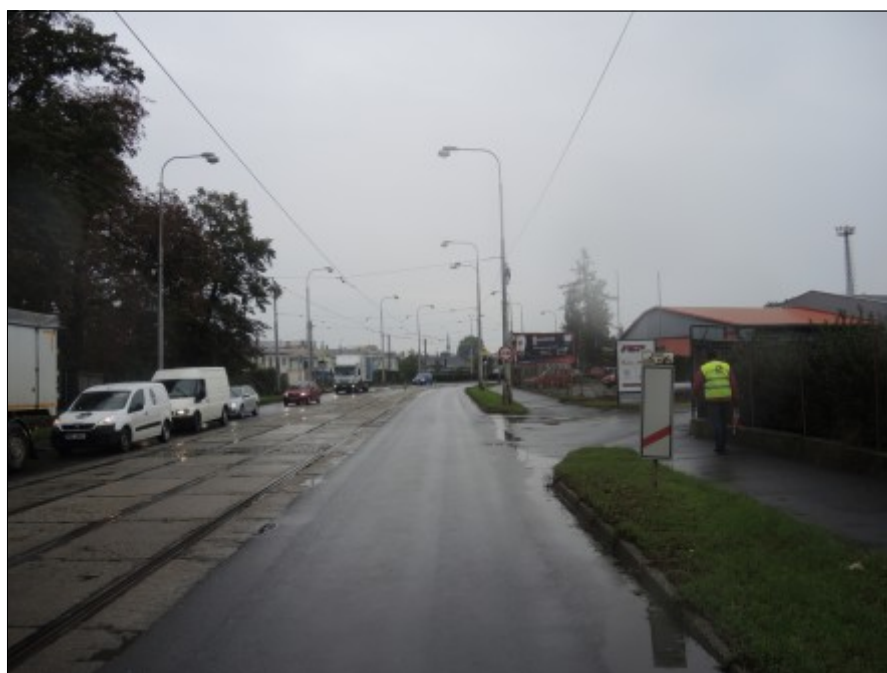
Obr. č. 4: Pohled na umístění svislé dopravní značky A 31c „Návěstní deska (80 m)“ a na výstražníky ve směru jízdy NA před ŽP P7519.