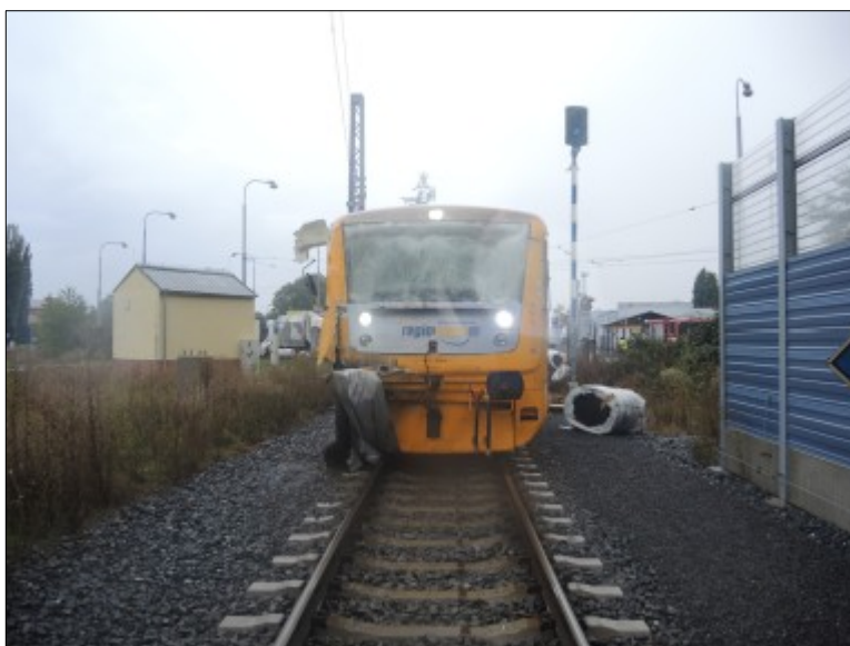
Obr. č. 1: Pohled na přední čelo HDV po vzniku MU.