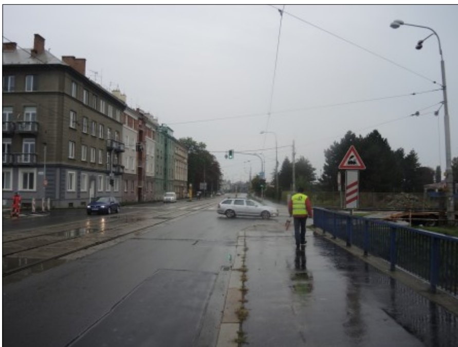
Obr. č. 3: Umístění svislých dopravních značek A 30 „Železniční přejezd bez závor“ a A 31a „Návěstní deska (240 m)“ ve směru jízdy NA před ŽP P7519.