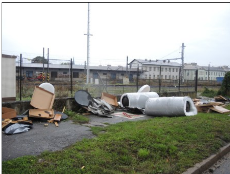
Obr. č. 6: Část nákladu, který se při střetnutí uvolnil z návěsu NA a poškodil oplocení pozemku ČD, a. s.