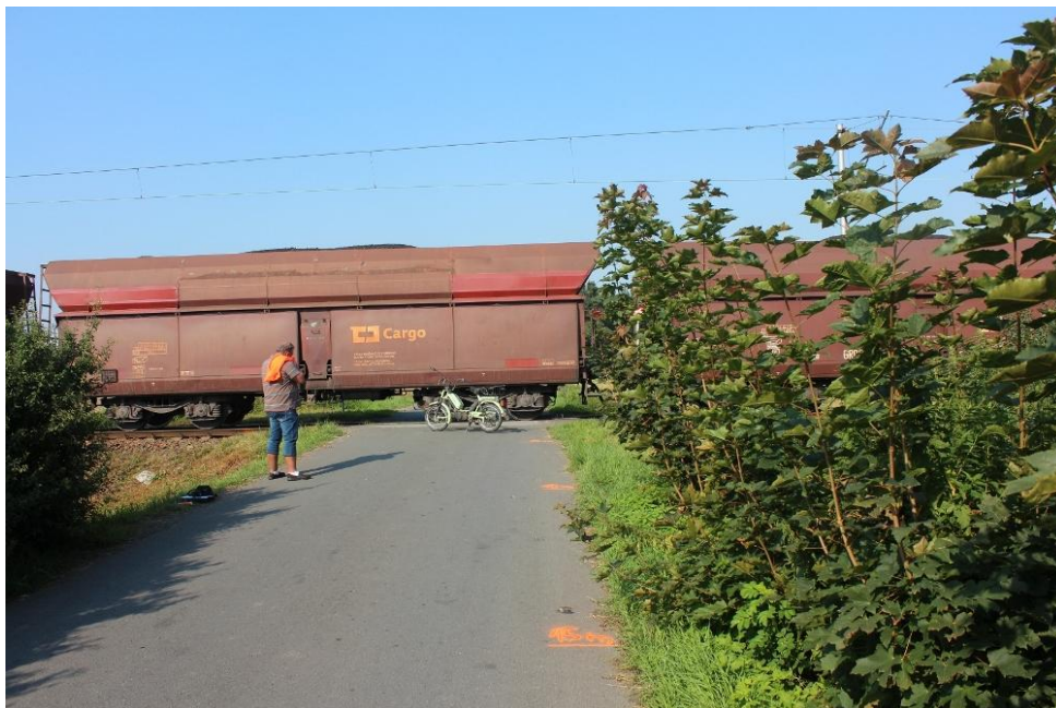
Foto 1: Pohled na přejezd a VK ve směru jízdy malého motocyklu ze vzdálenosti Dz = 15 m.