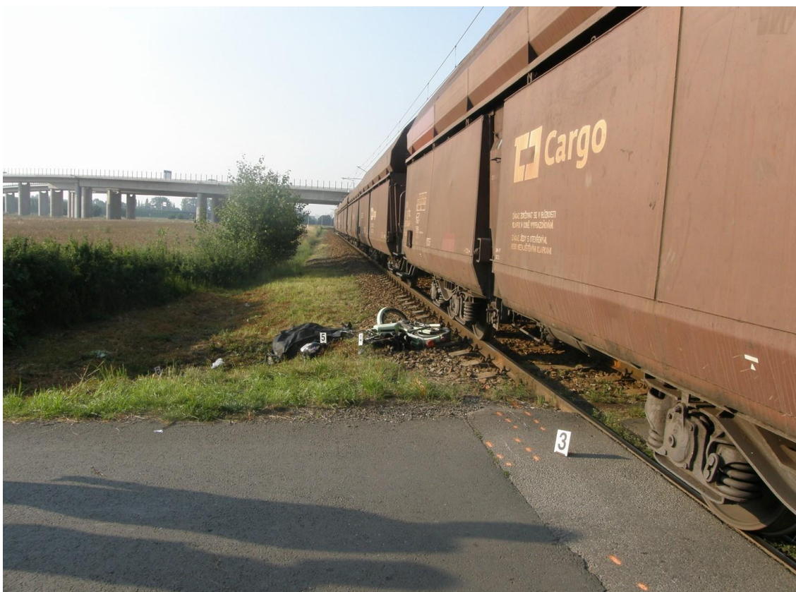
Obr. č. 2: Místo vzniku MU – poloha malého motocyklu a usmrčené osoby po zastavení vlaku.