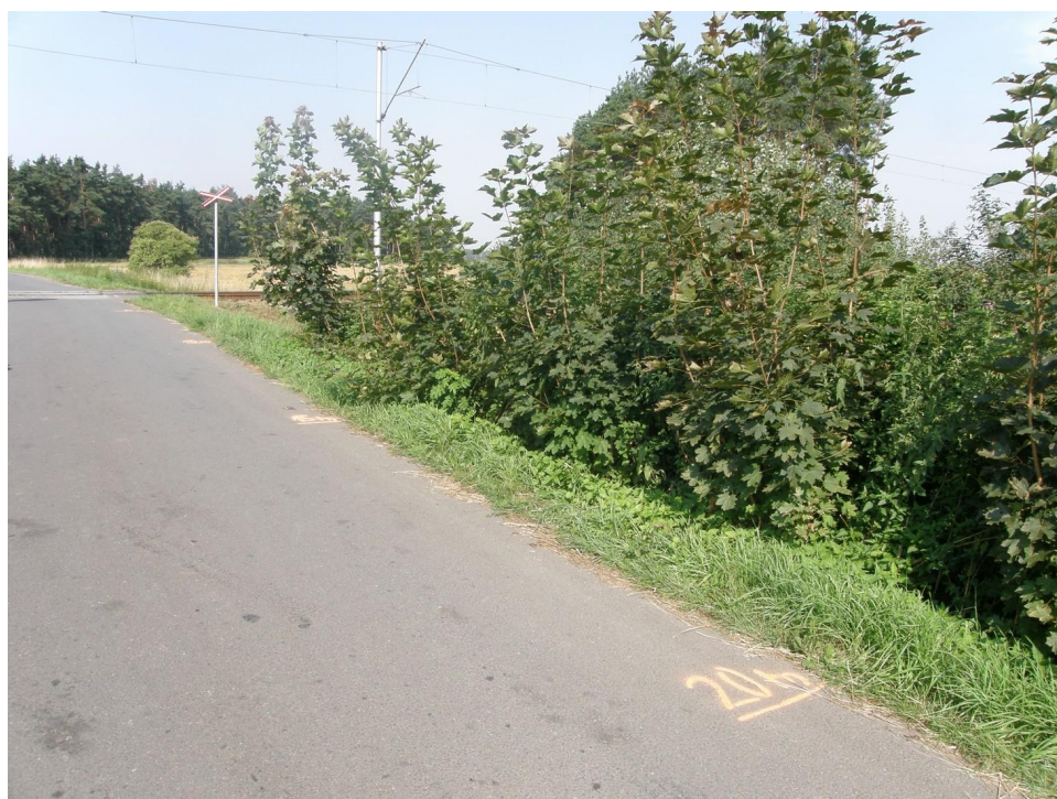
Foto 4: Celkový pohled na náletové dřeviny zasahující řidiči malého motocyklu do výhledu