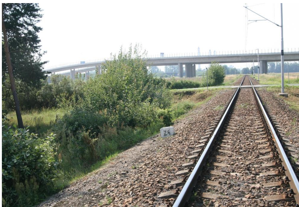
Foto 6: Přejezd z pohledu strojvedoucího na vzdálenost 42 m, malý motocykl přijel z levé strany.

Pozn.: Číselné hodnoty poznačené na vozovce, které je vidět na některých fotografiích, sloužily pro potřeby měření Policie ČR, nejsou to hodnoty Dz (liší se o cca 5 m).