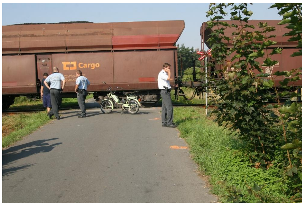
Foto 2: Pohled na přejezd a VK ve směru jízdy malého motocyklu ze vzdálenosti Dz = 10 m.