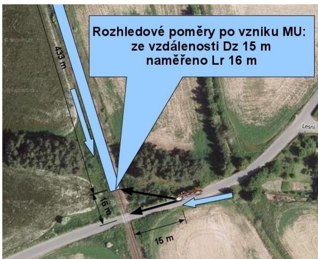
Obr. č. 3: Rozhledové poměry naměřené po vzniku MU dne 28. 7. 2012 (zdroj: www.mapy.cz )

Byla zjištěna nedostatečná viditelnost VK na délku rozhledu Dz = 15 m při jízdě silničního jednostopého vozidla v pravé části komunikace. VK byl v případě jízdy v pravé polovině vozovky zakryt listím a mladými výhonky náletových křovin, hustě rostoucími podél kraje vozovky. VK byl v tomto případě viditelný až přibližně ze vzdálenosti Dz = 10 m.