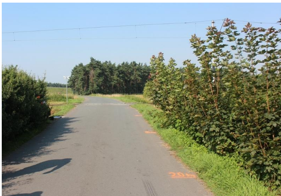
Foto 5: Celkový pohled na přejezd ve směru jízdy malého motocyklu, ze vzdálenosti Dz = 20 m.

Pozn.: Číselné hodnoty poznačené na vozovce, které je vidět na některých fotografiích, sloužily pro potřeby měření Policie ČR, nejsou to hodnoty Dz (liší se o cca 5 m).