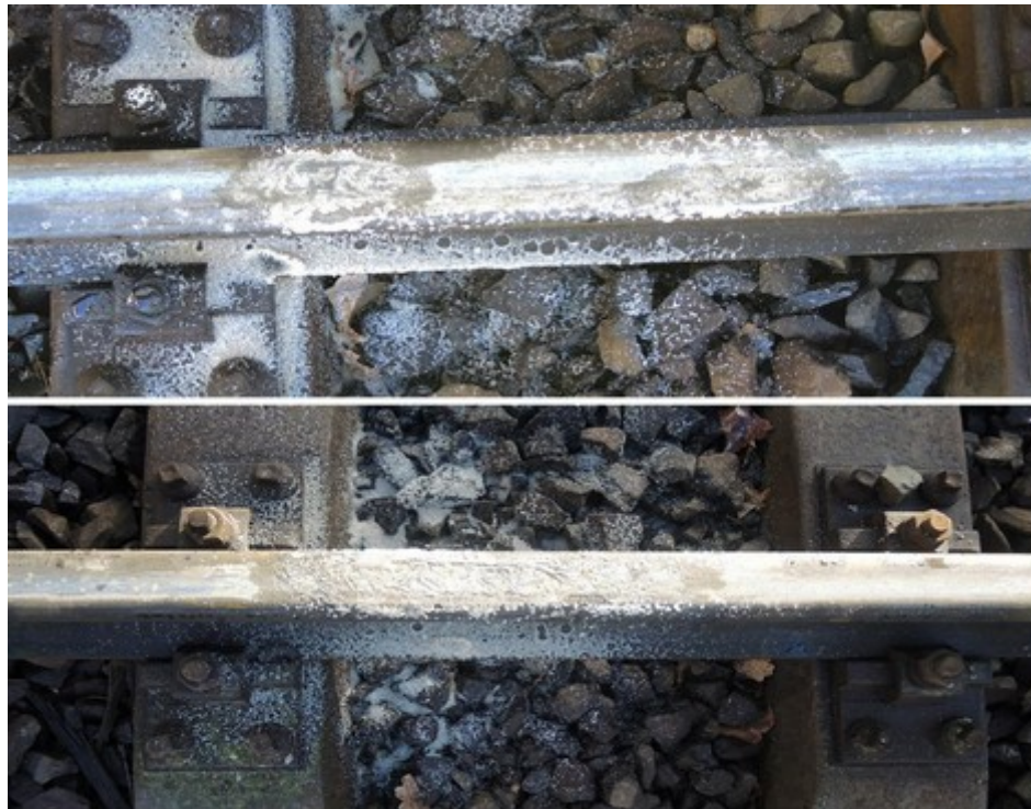
Obr. č. 6: Detail vrstvy písku na pojížděných hranách kolejnic.