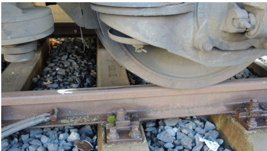
Obr. č. 4: Stopa smýkání prvního dvojkolí a poloha zastavení po zpětném odrazu soupravy.