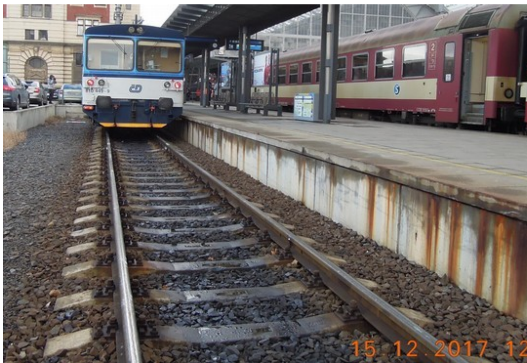
Obr. č. 5: Vnitřek koleje a místy i hlavy kolejnic před zarážedlem byly znečištěny ropnými látkami.