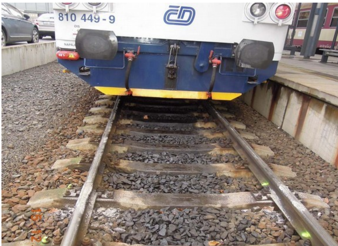
Obr. č. 3: Ve vzdálenosti 16,15 m před břevnem zarážedla byla na pojezděných plochách kolejnic vrstva písku tloušťky 2 mm a délky 40 cm. Za tímto znečištěním pokračovaly stopy po smýkání kol.