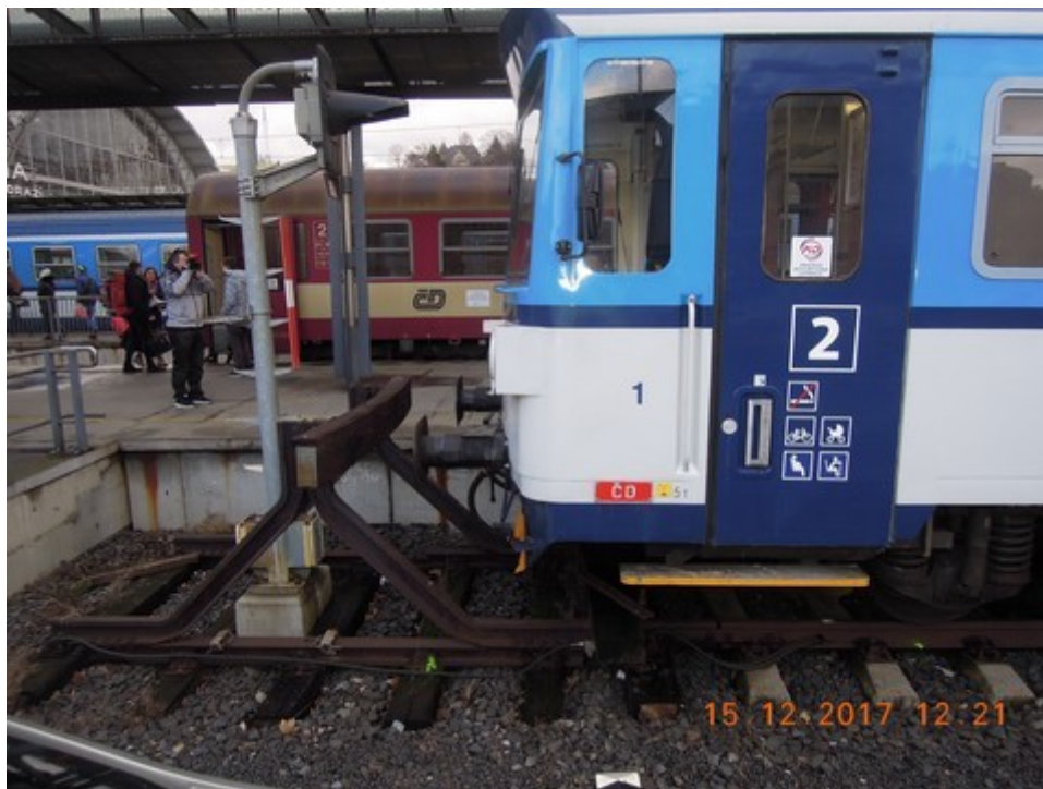
Obr. č. 1: Pohled na místo MU