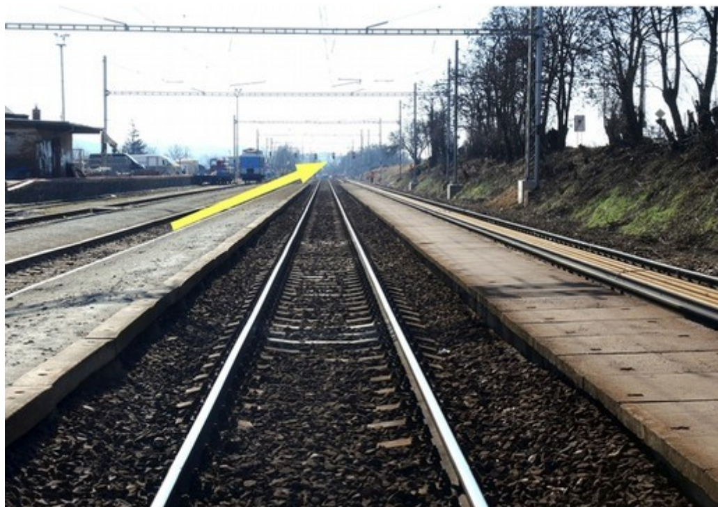
Obr. č. 3: Viditelnost odjezdového návěstidla S2 ze 2. SK v úrovni dopravní kanceláře ze vzdálenosti cca 340 m