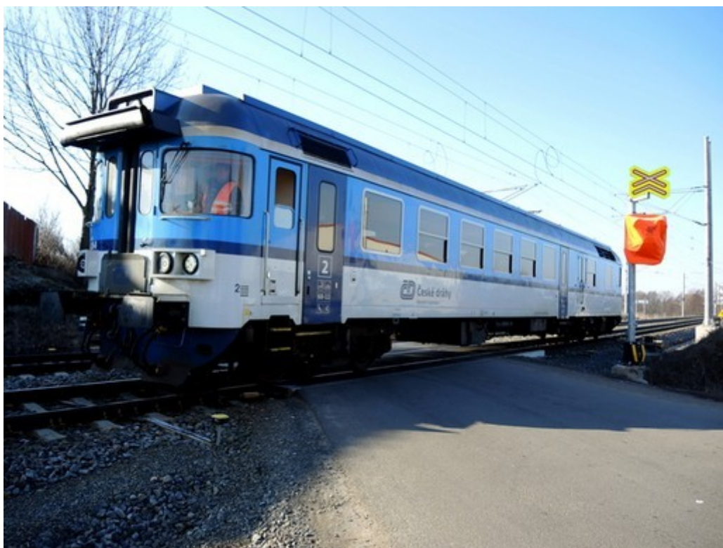
Obr. č. 5: Vlák Os 4140 stojící na ŽP P7900 v km 11,729