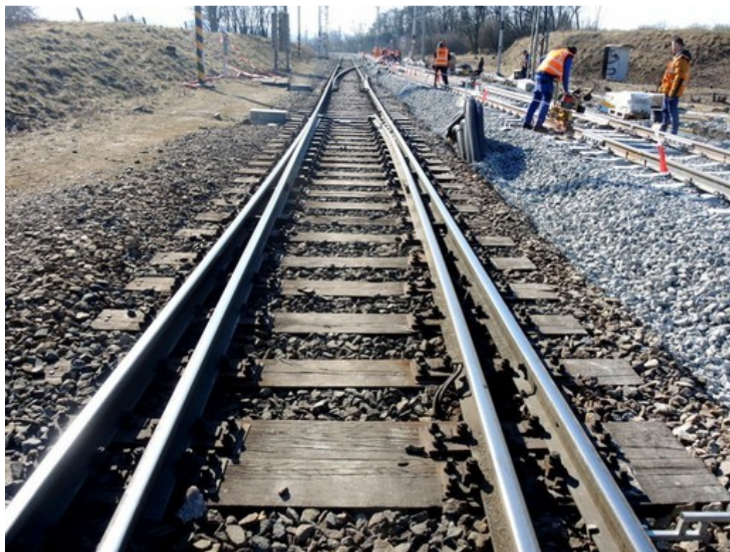
Obr. č. 4: Výhybka č. 3, řezaná jízdou vlaku Pn 62171