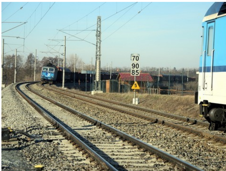
Obr. č. 1: Postavení vlaků po MU