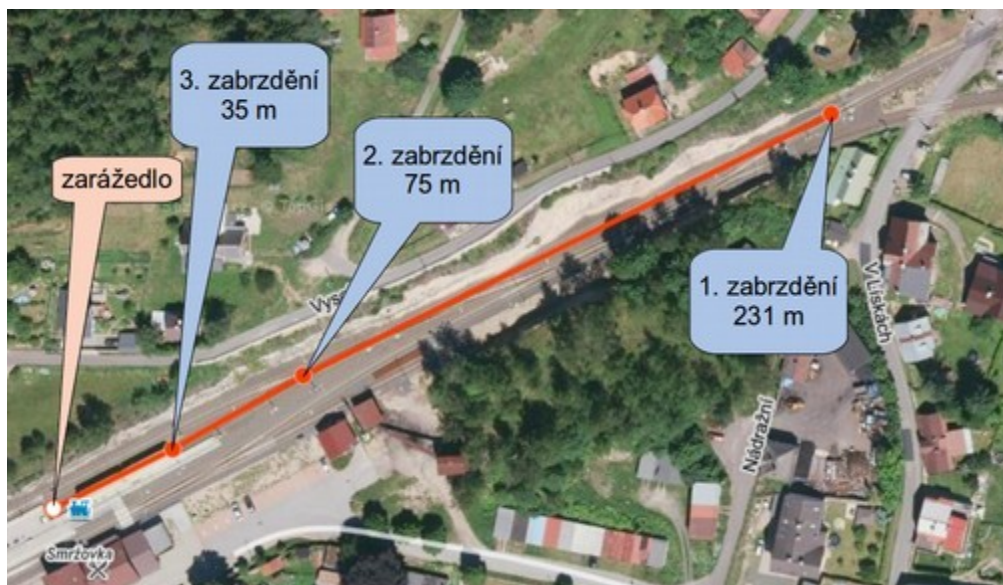
Obr. č. 2: Schéma jízdy vlaku před vznikem MU

Stůj v km 20,681, u kterého končila vlaková cesta, a srazil se se zarážedlem 3. SK, které se nacházelo v km 20,680, tj. 1 m za návěstidlem Sc3. Následkem MU došlo k újmě na zdraví tří cestujících.