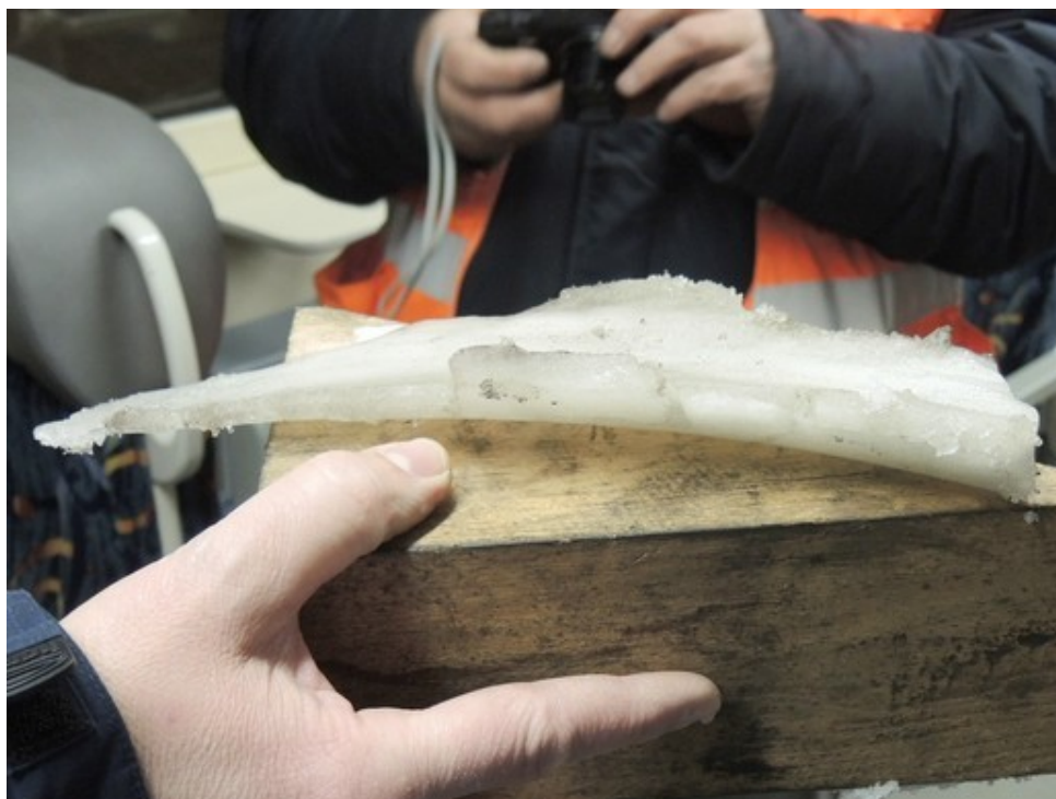
Obr. č. 3: Ledový výlisek, který vznikl mezi kolem a brzdovým špalíkem