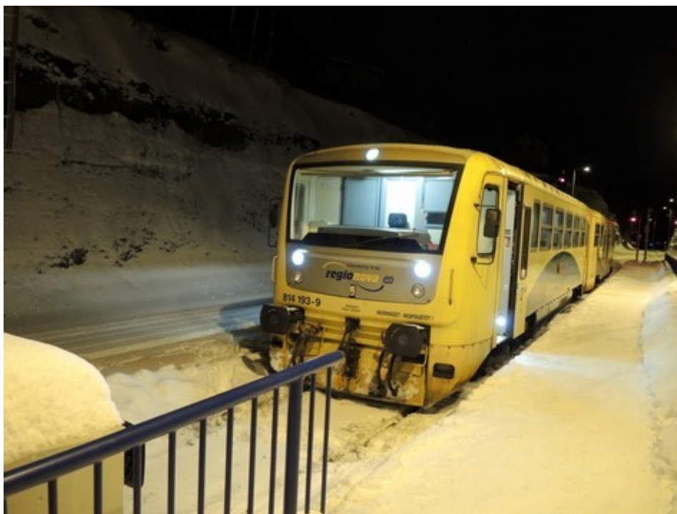
Obr. č. 1: Pohled na čelo vlaku po vzniku MU