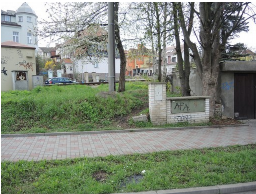
Obr. č. 8: Výhled z jízdniho pruhu na trať v předmětném kvadrantu