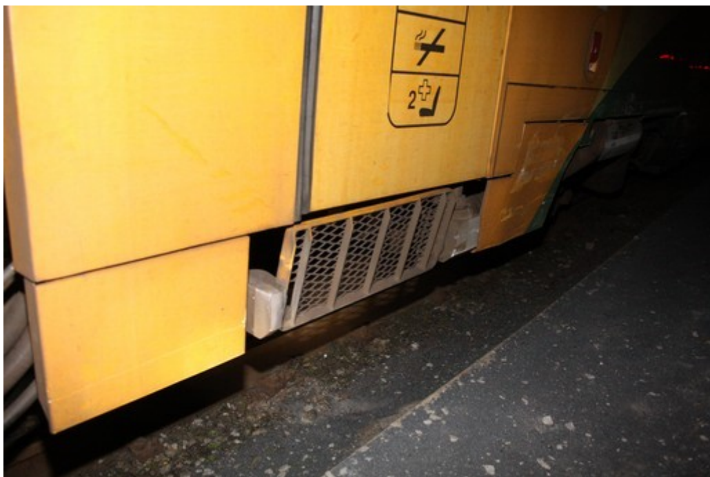
Obr. č. 6: Poškození motorové jednotky Regionova – HDV