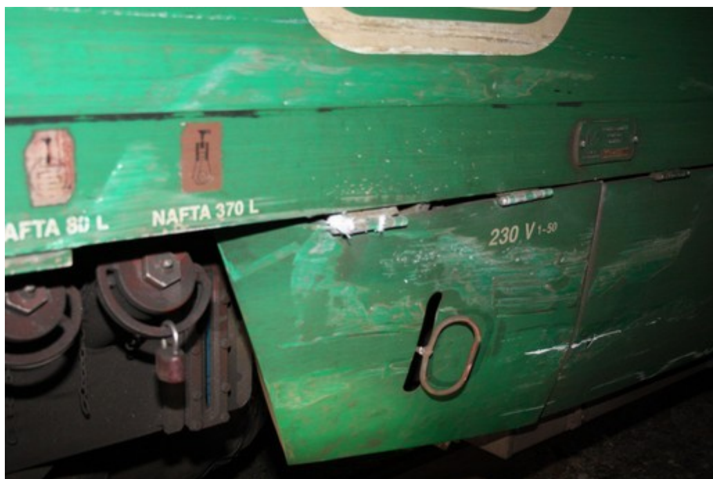
Obr. č. 7: Poškození motorové jednotky Regionova – HDV