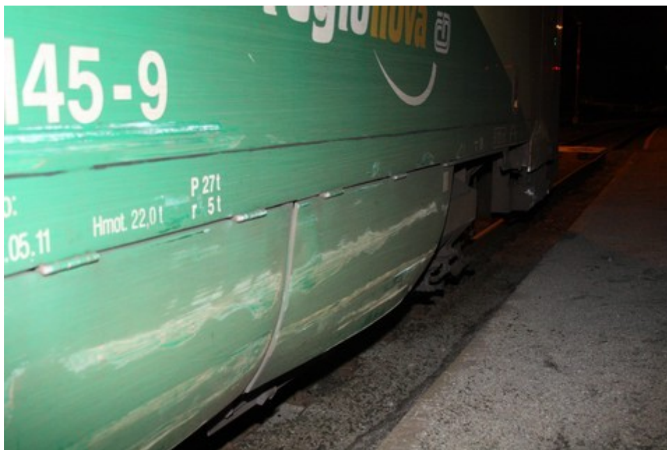
Obr. č. 1: Pohled na poškození HDV