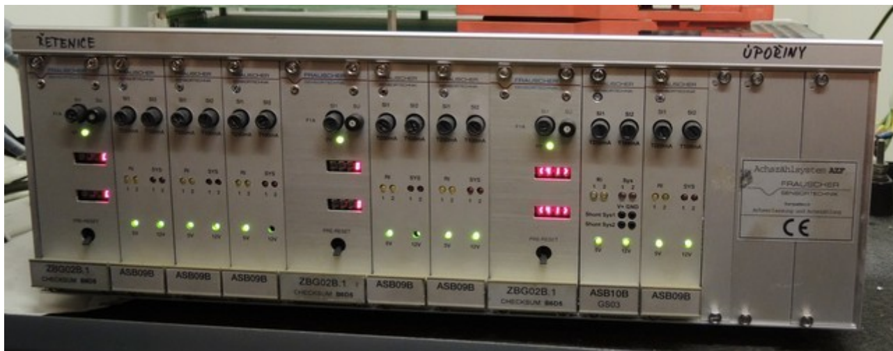
Obr. č. 4: Diagnostické zařízení kolejových úseků, 2 x kód „0“ a 1 x chybový kód „41“