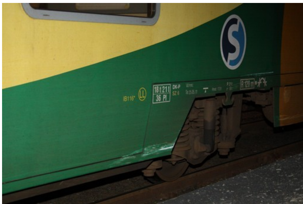
Obr. č. 5: Poškození motorové jednotky Regionova – řídicí vůz