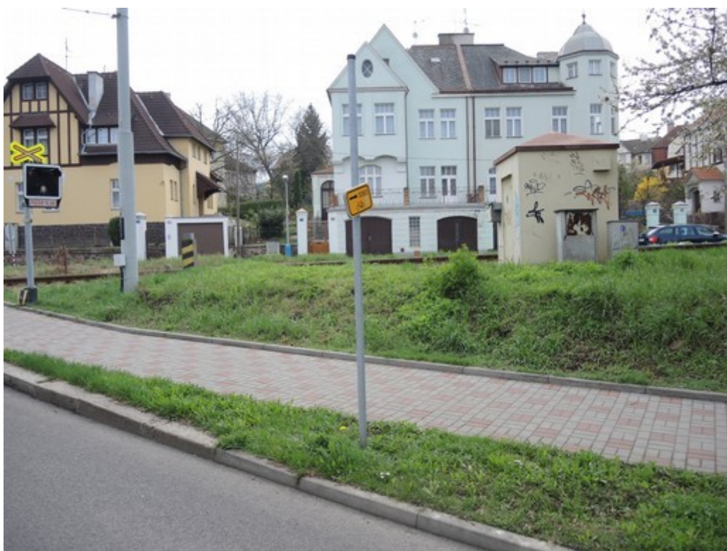
Obr. č. 9: Výhled z jízdniho pruhu na trať v předmětném kvadrantu