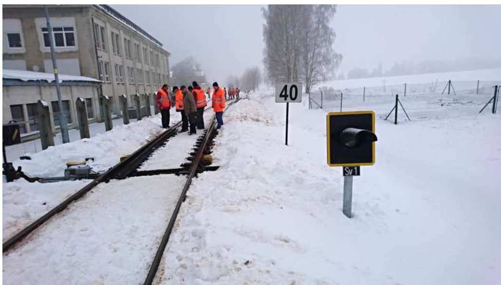
Obr. č. 1: Pohled na místo vzniku MU