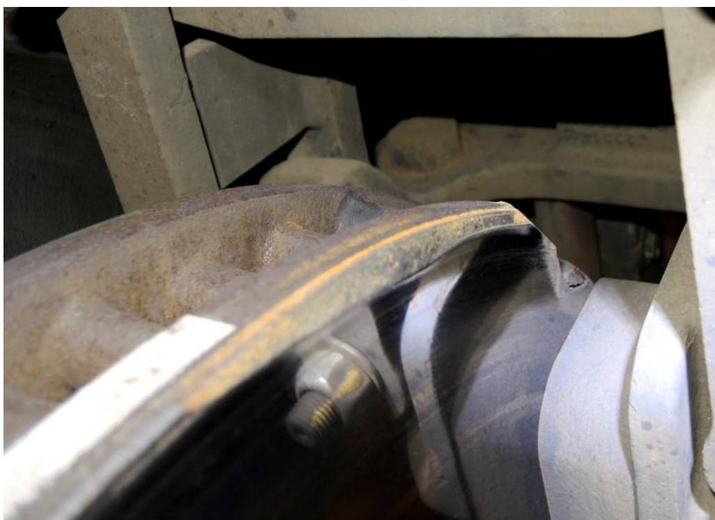
Obr. č. 6: Poškozená kotoučová brzda na podvozku, který vykoležil