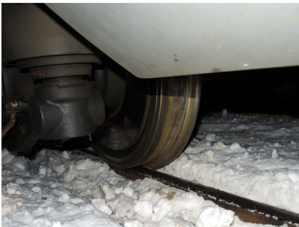
Obr. č. 5: Druhý podvozek HV nevykoležil