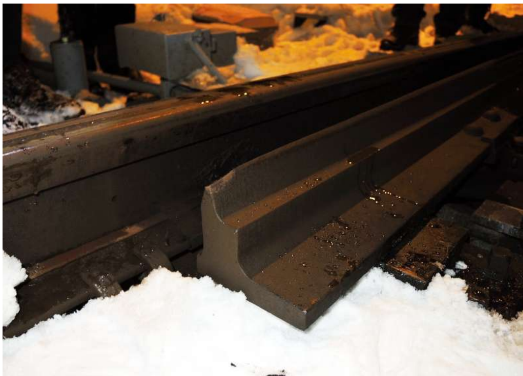
Obr. č. 3: Naražený levý ohnutý jazyk výhybky č. 1sv