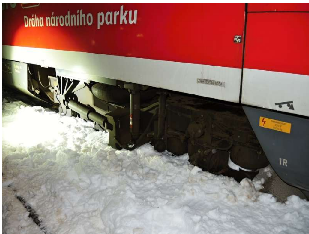
Obr. č. 4: Vykolejený první podvozek HV