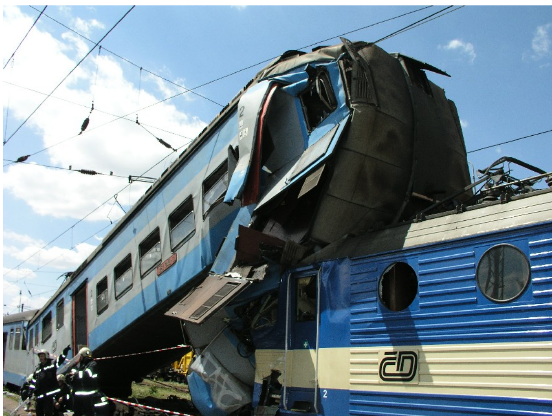
Foto 4: Deformované čelo HDV 451.048-3